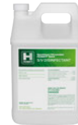
HUSKY® 803 S/V Disinfectant