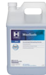
HUSKY® 441 MaxSuds

Sumerjir durante 10 segundos. Comparar mientras está mojado. Partes por millón.